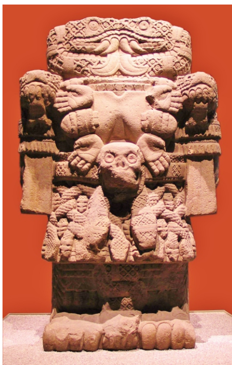
Estátua de Tonantzin Coatlicue, exposta no Museu Nacional de Antropologia da Cidade do México.

ao seu culto referências de outras deusas e suas antecessoras, reunindo assim essas características.