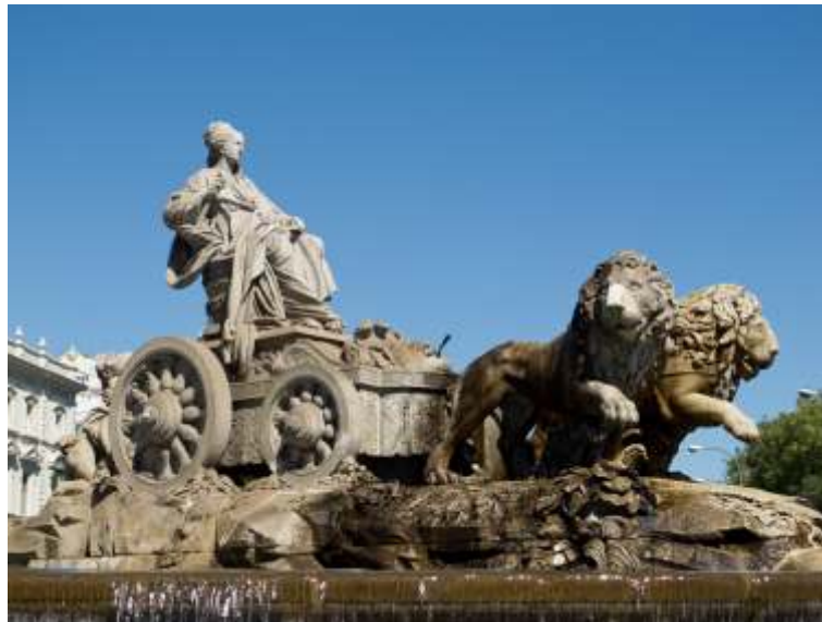
A Fonte de Cibele, em Madrid

jovem chamado Attis, que a traiu. Ao saber da traição, ela o castigou, enlouquecendo-o. Em uma de suas crises de loucura, Attis castrou-se e sangrou até morrer. Cibele, condoída com sua morte, transformou-o em um pinheiro e de seu sangue nasceram violetas. Então, todos os anos, ao chegar a primavera, Attis renascia e Cibele, feliz com seu retorno, fertilizava a Terra, enchendo-a de folhas e