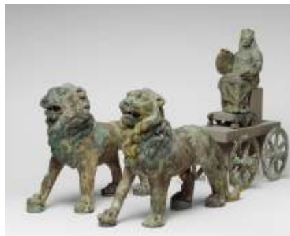
Estatueta de Bronze de Cibele - 150 a 200 d.C.

Cibele nos traz uma preciosíssima inspiração a respeito de nossas atitudes diante de uma traição, iminente ou concretizada. O mito não nos diz que Cibele ficou arrasada com a traição, que se sentiu a última das deusas e que se achou um mínimo. Ela fez o que quis fazer, e mais não demandou no caso, ainda que pudesse. Não se tem notícia de que tenha varado muitas noites insone, sem pregar olho, pensando em Attis e se achando péssima, coisas que fazemos quando atravessamos uma situação parecida.