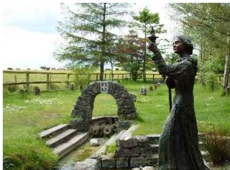
Fonte de Brigid em Kildare, Irlanda

continua sendo mantida até hoje pelas freiras da ordem Brigidina .