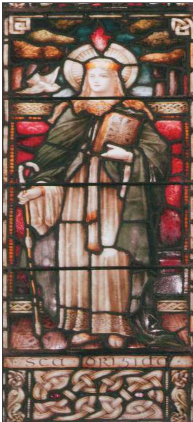
Vitral com representação de St. Brigid na Catedral de St. Brigid, Kildare

desapareceram algum tempo depois. Algumas das suas relíquias ainda existem em igrejas e museus como seu manto verde na Bélgica, seus sapatos no museu de Dublin e outros objetos em lugares mais distantes, que a santa viva jamais percorreu. Santa Brigid é padroeira da Irlanda (junto com São Patrício), das ordens das