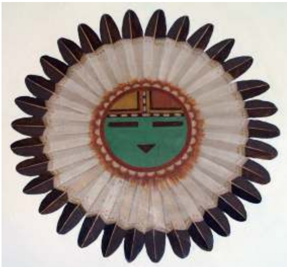
Tawa, o espírito do sol e criador na mitologia Hopi