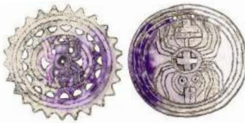
Pingentes antigos elaborados pelo povo Cherokee

No mito da tribo Coctaw de Tennessee e Mississipi, quando os seres humanos emergiram do mundo subterrâneo eles eram envoltos em casulos, seus olhos fechados e os membros colados ao corpo. O Grande Espírito teve pena deles e enviou seus auxiliares para retirá-los dos casulos e abrir seus olhos. Mesmo assim, eles não podiam ver nada, pois ao seu redor reinava a escuridão, não havia fogo, nem sol, nem lua, nem estrelas; as pessoas comiam tudo cru e eles sentiam muito frio e tristeza. Permeados pela escuridão, as tribos humanas, os animais e os pássaros se reuniram em um pow-wow para encontrar uma solução. Um pássaro avisou que nas terras do leste havia fogo, fazia calor e luz e que eles deviam pedir isso para eles. Mas outras vozes disseram que os povos do leste eram avaros e não iriam partilhar suas posses, por isso alguém deveria ir lá e roubar o fogo. Alguns animais como o gambá, o urubu e o corvo se ofereceram e tentaram roubar pedaços de lenha incandescente, mas queimaram as penas e o pelo por desconhecer o poder do fogo. A fumaça das suas queimaduras assinalou aos povos do leste sobre o roubo e eles os perseguiram e tiraram as brasas roubadas. Nesta situação crítica, a Avó Aranha se ofereceu para ajudar, mas ninguém acreditou que ela fosse capaz desta proeza. Mesmo assim, ela decidiu tentar e usando de toda a sua sabedoria e