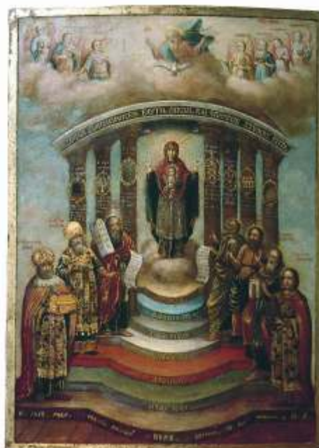
Iconografia Russa, Sophia, a Sagrada Sabedoria, 1812.

No século 13 nasceu na Rússia um movimento - baseado na tradição gnóstica - chamado Sophiology, que propõe a cognição do absoluto através da contemplação de Sophia como sua emanção. O seu criador - Vladimir Solovyov - teria tido três encontros místicos com Sophia, que o iluminaram e o levaram a estudar teologia, cabala e filosofia egípcia. Na sua visão, Sophia era semelhante a Ísis e a aparição dela era acompanhada de aroma de rosas. Foi pela conexão com Egito que o culto de Ísis foi transformado na crença em Sophia,