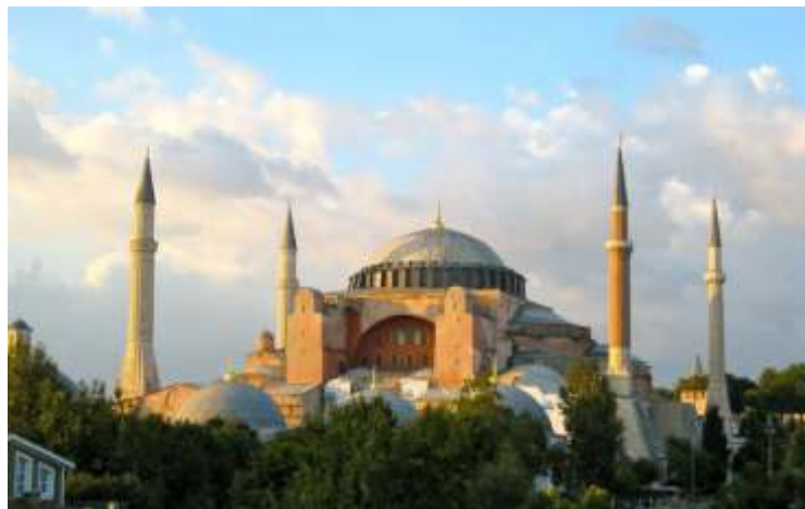
Hagia Sophia de Constantinopla, Istanbul - Turquia.

No cristianismo a sabedoria divina é um tema muito importante, aparecendo nos evangelhos e nas cartas dos apóstolos. Ela é especialmente reconhecida no cristianismo ortodoxo, onde é identificada com a palavra divina (logos) personificada pelo Cristo. O melhor exemplo deste respeito pela sabedoria divina é a grandiosa basílica Hagia Sophia de Constantinopla (transformada depois em mesquita e atualmente sendo museu).